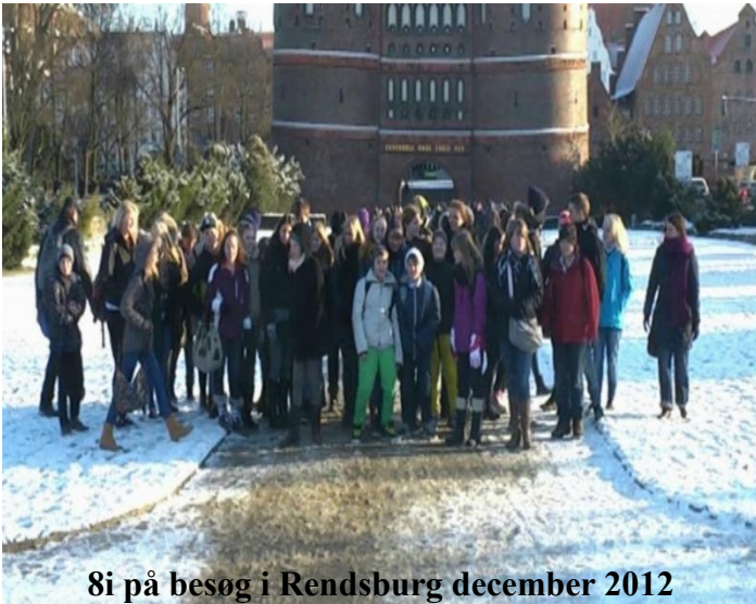
8i på besøg i Rendsburg december 2012

På den internationale toning er retningsfagene engelsk, tysk og dansk. I disse fag vil der blive givet et højere timetal. Vi har venskabsbysamarbejde med Schule-Alstadt i Rendsburg. Samarbejdet vil dække 7. — 9. årgang, dog med hovedvægt på 8. årgang, hvor der vil være besøg og genbesøg (af op til fire overnatninger) med privat indkvartering. Samarbejdsproget vil