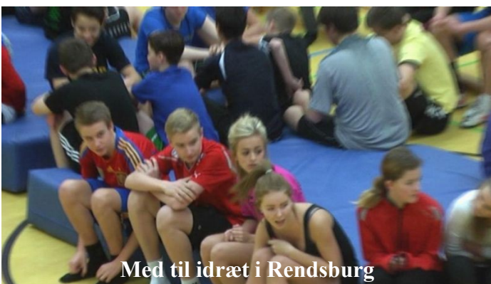
Med til idræt i Rendsburg

Du skal vælge den internationale toning, hvis du kan genkende dig selv i et eller flere af følgende ud-sagn: